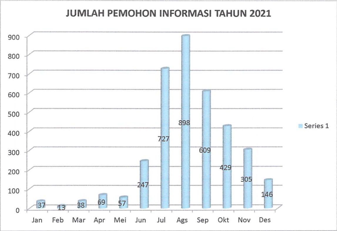
Gambar 2. Grafik Jumlah Pemohon Informasi Publik Tahun 2021