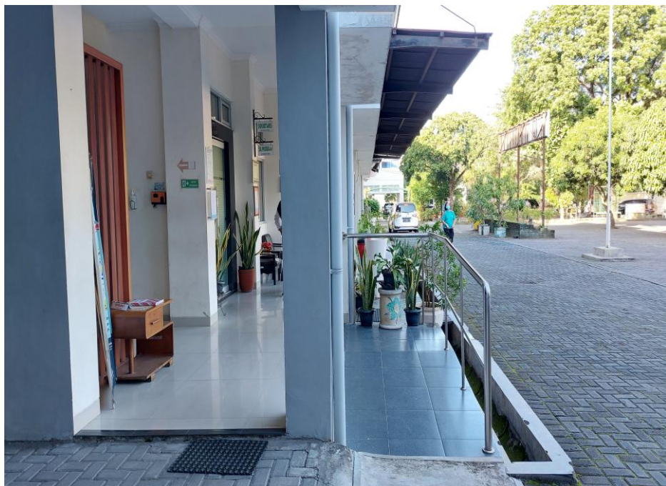
Gambar 5 Foto ramp menuju ruang layanan PPID