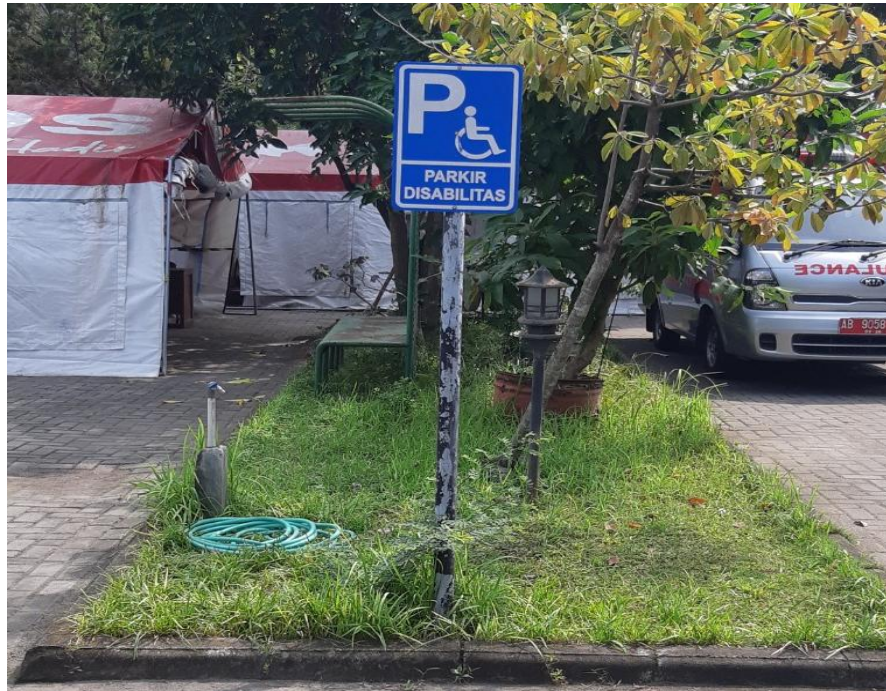
Gambar 4 Foto tempat parkir untuk disabilitas