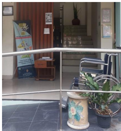
Gambar 3 Foto front desk layanan informasi publik dengan fasilitas kursi roda