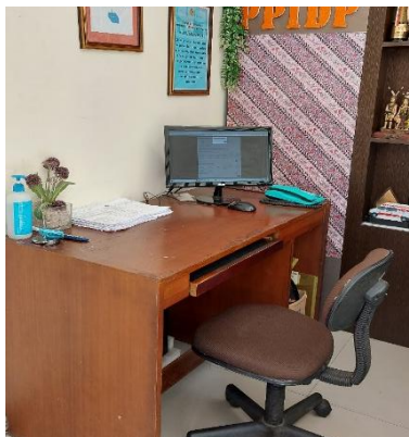
Gambar 2 Foto front desk layanan informasi publik